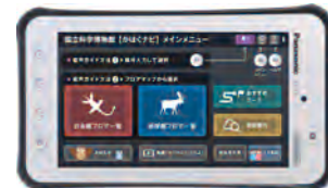
คะชะคุเนวิกเตอร์

คะชะคุเนวิกเตอร์ และโค้ดเสียง [ค่าบริการ 320 เยน (สำหรับผู้พิการ ฟรี)] สามารถผลิตพินกับรายการอธิบายจากนักรีวิวเกี่ยวกับนิทรรศการต่างๆภายในพิพิธภัณฑ์ รองรับภาษาญี่ปุ่น (รูปแบบสำหรับผู้ใหญ่หรือเด็ก) ภาษาอังกฤษ ภาษาจีน และภาษาเกาหลี