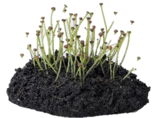
クックソニア (模型) 大阪市立自然史博物館 蔵