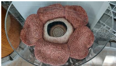
ラフレシア (模型) 京都府立植物園 蔵