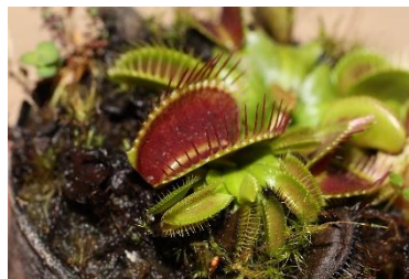
ハエトリソウ 基礎生物学研究所

人間と植物はじつは同じ構造？じっとしているように見えて、じつはアクティブ？ 身近な存在でもある植物のミステリアスな姿を解き明かします。「ダーウィンの蘭」と呼ばれる蘭、アングレカム・セスキパダレや世界で初めて開発に成功した「青いキク」など、めずらしい植物も多数紹介します。