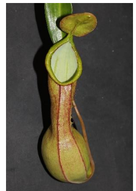
ウツボカズラ 基礎生物学研究所