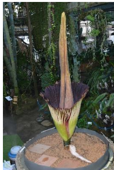
ショクダイオオコンニャク 国立科学博物館筑波実験植物園