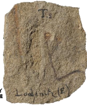
クックソニア・バランディ チェコ国立博物館 蔵

最大から最小まで、古代から現代まで、身近なものからめずらしいものまで、さまざまな観点から植物を全般的に網羅した、これまでにない大規模な展覧会です。