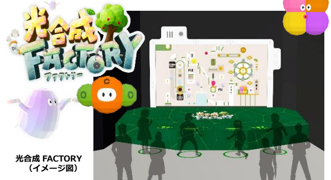
光合成 FACTORY (イメージ図)