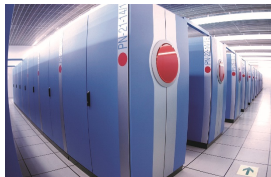
地球シミュレータ（初代）

地球規模で起こる自然現象について理解し、将来の地球の姿を予測するには、高精度のシミュレーションが必要です。このコーナーでは、歴代のスーパーコンピュータ「地球シミュレータ」とその成果について紹介します。