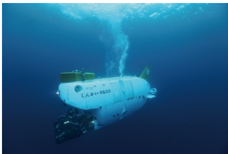
有人潜水調査船「しんかい6500」

四方を海に囲まれた日本では、海底の様子を明らかにしようという挑戦が世界的にも早い段階から始められました。海洋科学技術センター（現：国立研究開発法人海洋研究開発機構）が1971（昭和46）年に創立されてからは、有人潜水調査船「しんかい6500（※1/2模型を展示）」などの各種船舶や探査機等が開発・運用されるようになり、調査船を用いて世界中の海で調査を行うことで、海や地球、生命の謎を解き明かすことにつながる多くの科学的発見を成し遂げてきました。このコーナーでは、日本における海洋調査の歴史、各種船舶や探査機の特徴や仕組み、海洋汚染など、JAMSTEC や当館が実施した調査から得られた成果について紹介します。