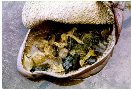
クジラの胃から見つかったプラスチックごみ