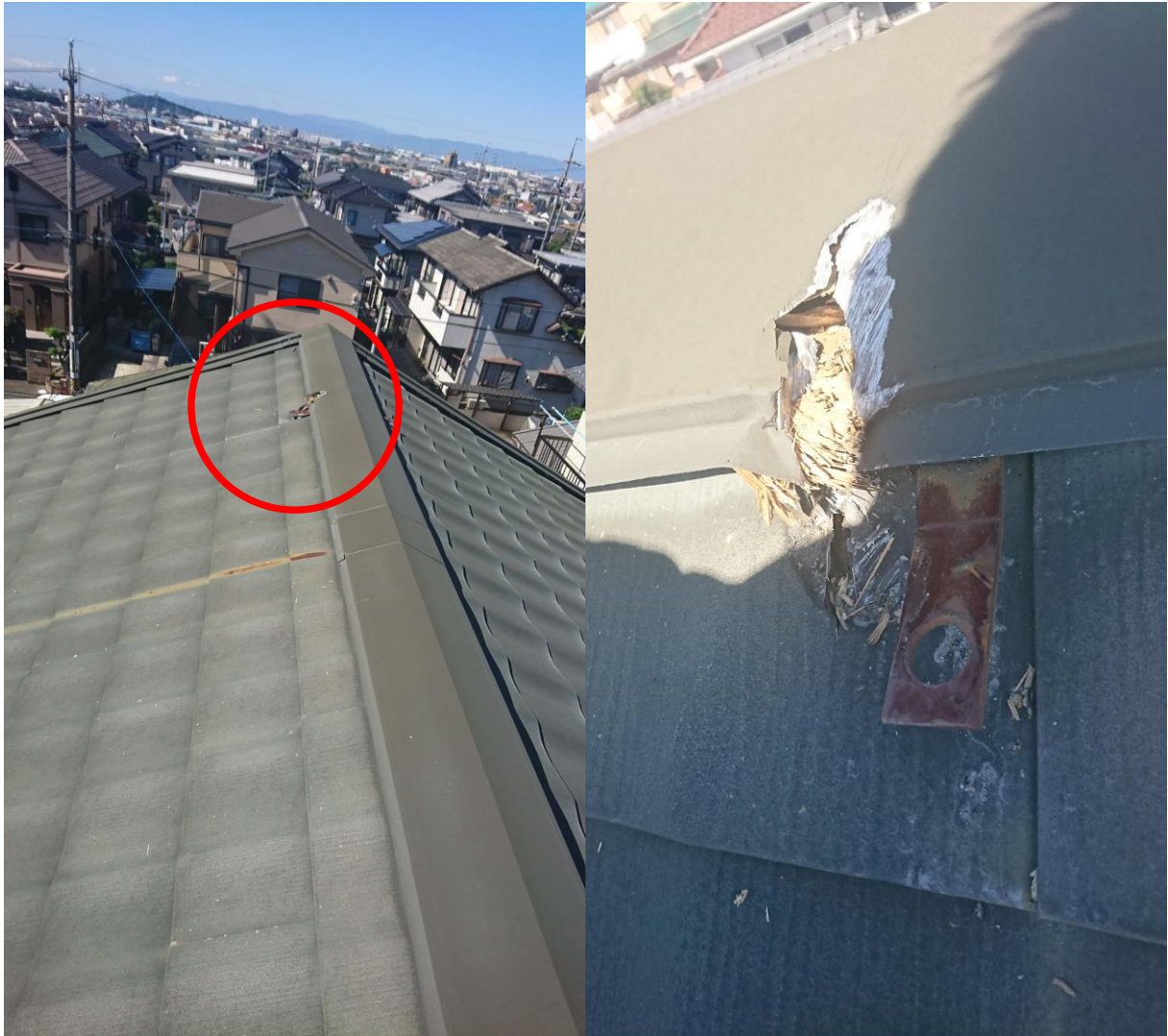
隕石が当たった屋根