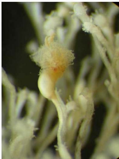
エノコロフサカツギの標本(国立科学博物館蔵)