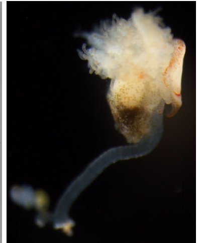
棲管から取り出した虫体 (長さ 3mm 程度)