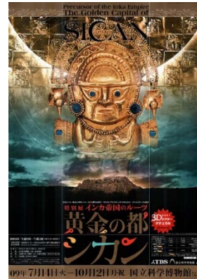
「インカ帝国のルーツ 黄金の都シカン」 (2009) ポスター