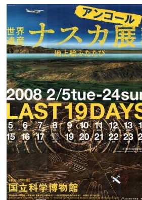
「世界遺産 ナスカ展—地上絵の創造者たち」 (2008) ポスター