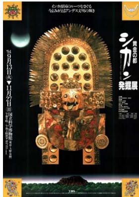
「黄金の都 シカン発掘展」 (1994) ポスター