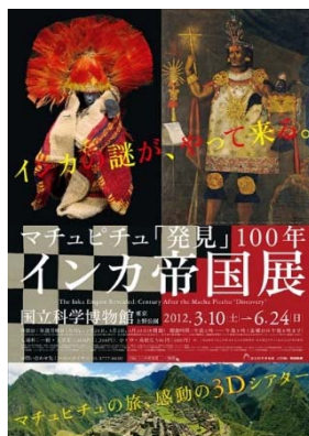
「マチュピチュ発見 100年 インカ帝国展」 (2012) ポスター