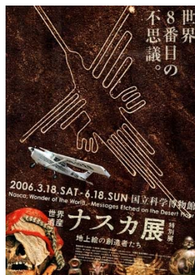
「世界遺産 ナスカ展—地上絵の創造者たち」 (2006) ポスター