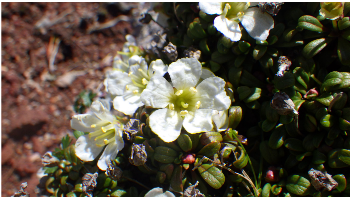
図1 イワウメの開花の様子

また前述の技術開発の過程で、イワウメの葉からも多数の成分を単離して構造解析に成功し、紫外線防御や抗酸化に寄与する成分を見出し、さらにその成分の一部の蓄積には、日本列島の本州中部から北海道で地理的な差異があることなども発見した成果が「Biochemical Systematics and Ecology」に掲載されました。今回は、この研究をさらに改良したものになります。なお、農業産業分野の国内誌「アグリバイオ」の記事でも、本研究のポイントなどをまとめて紹介しています。