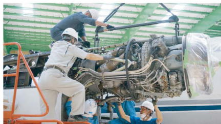
「YS-11」のエンジンの組立の様子

このパネル展では、我が国戦後復興の象徴であり、航空ファンにも名機と名高い当「YS-11」の現役時代の姿や分解・移送・組立について、写真でご紹介します。