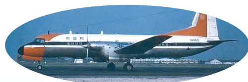
飛行検査機当時のYS-11

国立科学博物館は、唯一の純国産民間輸送機である「YS-11」量産初号機を20年にわたり羽田空港で整備・保管してきました。本機を多くの方に見ていただくために、ザ・ヒロサワ・シティ(茨城県筑西市)に移設しました。