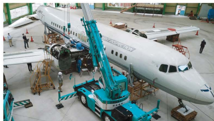
クレーンでの主翼の組立の様子