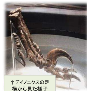
↑ディノニクスの足横から見た様子

「恐ろしいツメ」を意味する学名のもとになったディノニクスの重要な標本の足と手が日本初上陸。