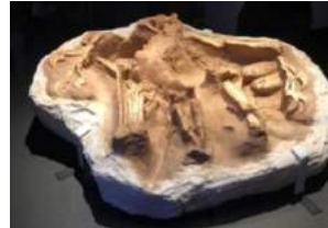
卵の上に覆いかぶさるような状態で発見された↑シチパチの化石