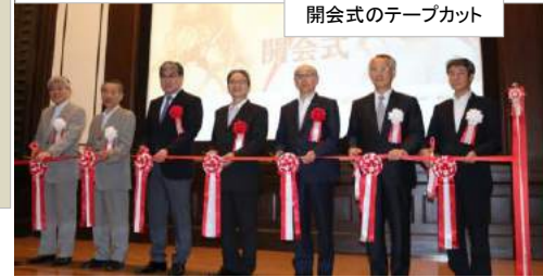
↓プレス内覧会 開会式のテープカット

7月12日に国立科学博物館で行われた特別展「恐竜博2019」の プレス内覧会 に参加しました。今回の見どころは恐竜ネナクス・「謎の恐竜」デイクケルス・「むかわ竜」東京に 初上陸 ・「恐竜絶滅」に迫る! というものでした。平日で小雨の降る中、プレス内覧会には多くの方が参加していました。