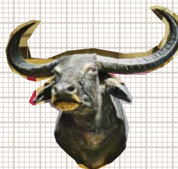
アジアスイギュウ