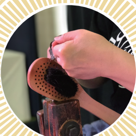
東京手植ブラシ、 江戸刷毛