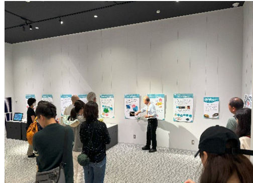
展示ツアーの様子