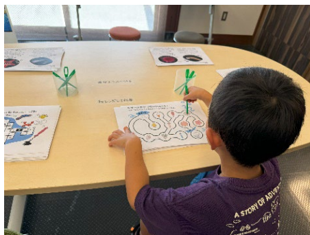
ワークシートに自由に 取り組めるエリア