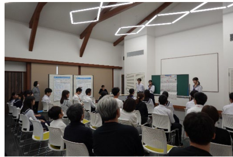
七尾高等学校の生徒による ポスター発表 (全9班)