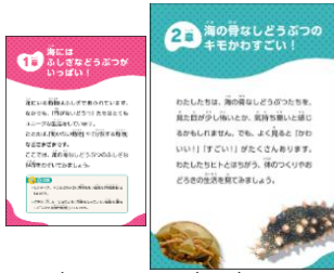
章パネル (A2) 解説パネル (A1)