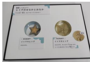
イトマキヒトデの標本