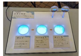
ポリプ・ストロビラ・エフィラの観察キット