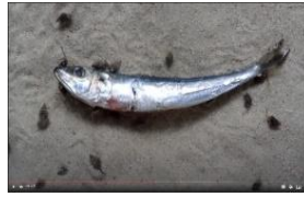
魚の死がいに集まるアラムシロガイの映像 (48秒)