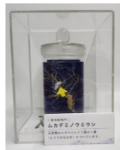
ムカデミノウミの標本