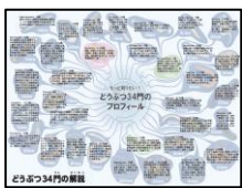
動物34門の紹介パネル (A1)

1章で紹介するどうぶつ34門それぞれを解説します。パネルの掲出が難しい場合や、持ち帰り用に配布したい場合はデータの提供も可能です。