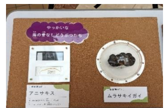
アニサキス・ムラサキイガイの標本