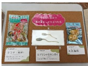
塩蔵クラゲ・ミドリシャミセンガイ・海綿の標本