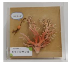
モモイロザンゴとストラップの標本