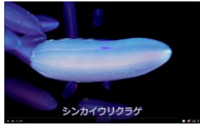
ヤドカリ、ヒトデ、ナメクジウオ、ウリクラゲ、タコクラゲの映像 (57秒)