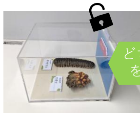
マボヤ・オキナマコの標本 (鍵付き)