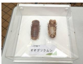
オオグソクムシの標本