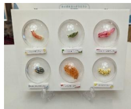
ウミウシのフィギュア