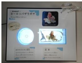
ホヤの観察キット