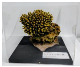
ミドリイシの標本