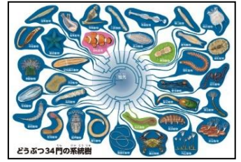
動物34門の系統樹をプロジェクターで投影

印刷済みパネル (額装入) やモニター・プロジェクターの貸出希望がございましたらご相談ください。