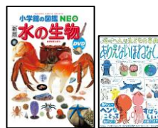
回覧用 参考書籍 2冊

もっと知りたいという方向けに、書籍の紹介と国立科学博物館で開催した企画展をVRで体験できるサイトを紹介します。