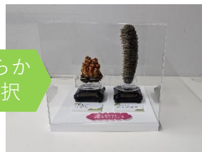
マボヤ・オキナマコの標本 (回転台)