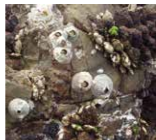
フジツボ類、カメノテ、オハグロガキ、クジャクガイ、ヒザラガイ、笠貝類。