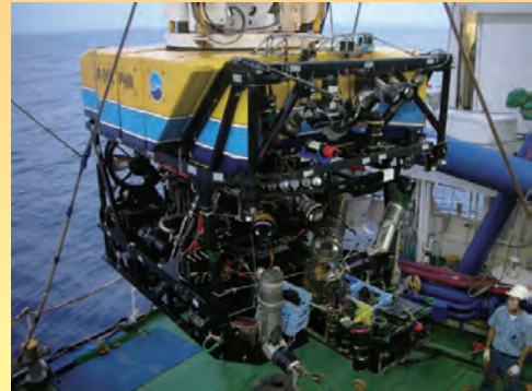
無人探査機「ハイバードルフィン3000」

我々人類が暮らしている陸地は主に花崗岩 みこうがん から形成される大陸地殻から成ります。花崗岩は太陽系惑星のなかでも地球にしか存在しない不思議な岩石で、花崗岩質の大陸地殻が地球の46億年の歴史のなかで、どこで生まれ、どのようにして現在のような姿にまで成長してきたのかは依然としてよくわかっていません。