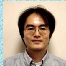
鯨類（ハクジラやヒゲクジラの仲間）や陸脚類（アシカ、セイウチ、アザラシの仲間）を中心に、哺乳類がどのように水生適応したのか、化石を使って研究しています。最近では、ここで紹介する束柱類（デスモスチルスやパレオパラドキシアの仲間）の古生態を、機能形態学、同位体地球化学などさまざまな手法で研究しています。

今からおおよそ1800~1300万年前、北太平洋沿岸にはデスモスチルスと呼ばれる奇妙な海生哺乳類が生息していました。この中間は、1888年に最初の化石が報告されて以来、特異な形をした歯の化石しか見つからなかった時期が長かったため、ごく最近まで「幻の奇獣」と呼ばれていました。そして、最初の発見以来120年経ってなお、この動物がいったいどこで何を食べていたのか、未だに意見が一致していません。幸い、国立科学博物館（NMNS）には世界で最初に発見されたデスモスチルスの頭蓋が所蔵されていることから、私はこの問題を解決すべく、顎運動の形態機能解析を改めて行なうと共に、共同研究者と共に歯の表面に残された細かな摩耗痕や体内で歯が作られたときの元素組成（同位体比）などを調べています。現在、私たちはおおよそ「これが結論」といえるような仮説にたどり着きつつあります。この謎に包まれていた絶滅哺乳類の古生態を、私たちがどのように解き明かしたのか簡単に紹介しましょう。