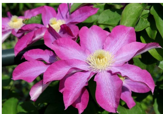
柿生（かきお） 世界的にも名高いクレマチス育種家の故・小澤一薫氏により作出された、カザグルマの流れを汲むパテンス系の代表的品種