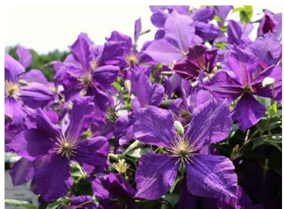
ジャックマニー・スパーバ ジャックマニー系の品種で6月上旬に咲き乱れる