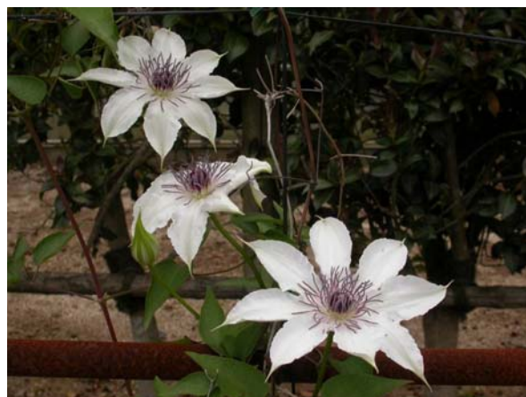
カザグルマ 茨城・水戸産