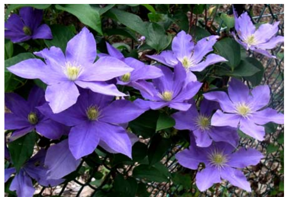
藤娘（ふじむすめ） 日本を代表する品種で当園の人気 No. 1 品種