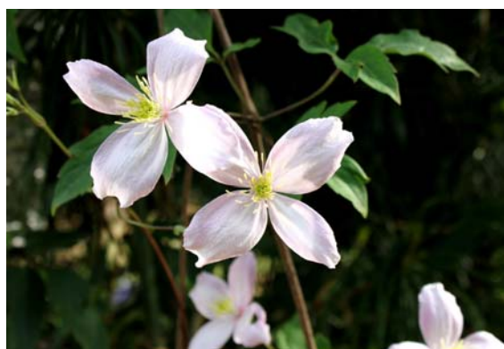
エリザベス 今年が多花性で甘い香りも楽しめるモンタナ系品種（エリザベスやメイリーンなど）が多く開花する予定