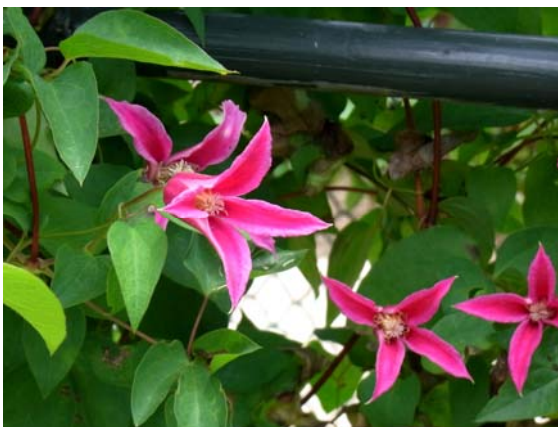
プリンセス・ダイアナ テキセンシス系のチューリップ咲き品種