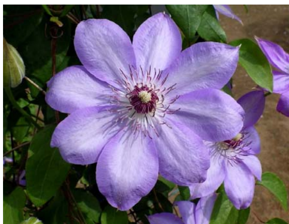
カザグルマ 群馬・長野原産