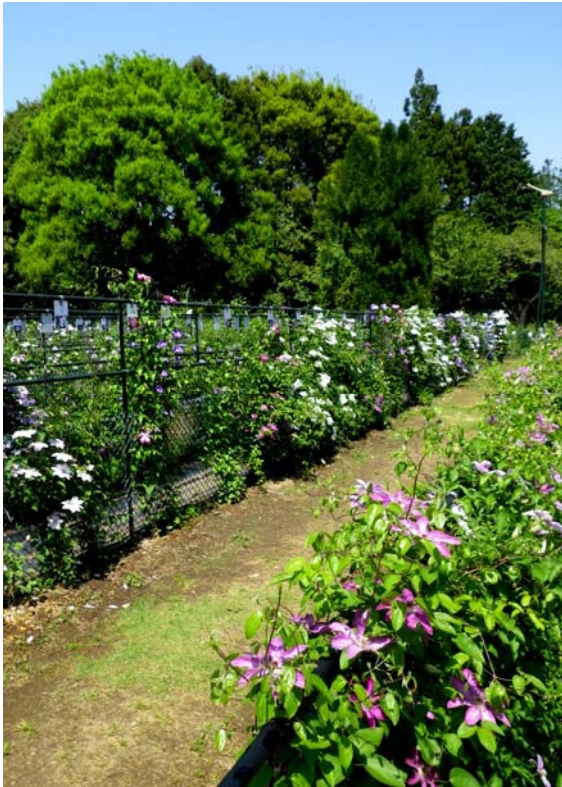
5月上旬の園内（パテンス系など）