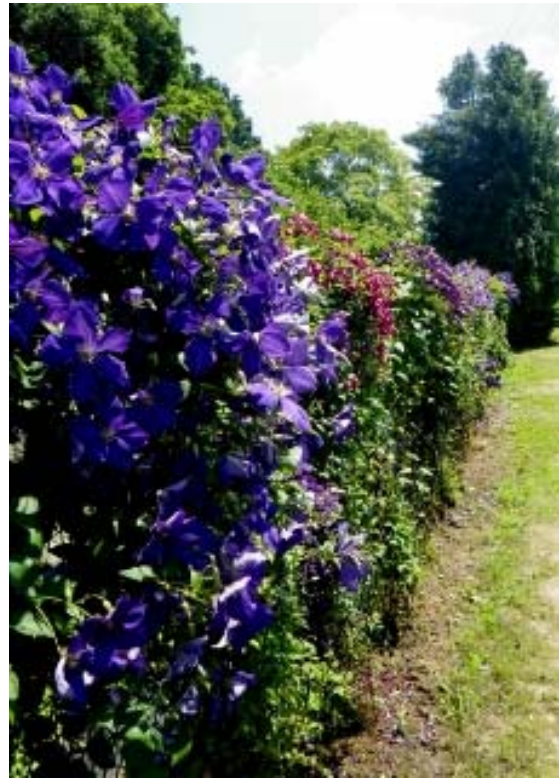
6月上旬の園内（ジャックマニー系など）