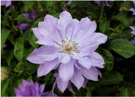
天塩（てしお） さわやかなラベンダーブルーの八重咲き品種で、花つきも良く人気