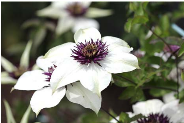
テッセン（鉄線） かつてクレマチスが「鉄線」と呼ばれていたのは、この花に由来する