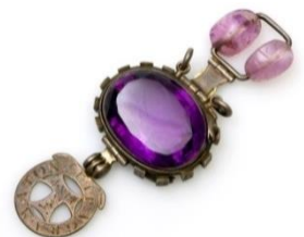
＜呪われたアメジスト＞