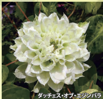
ダッチェス・オブ・エジンバラ

「クレマチス」(キンポウゲ科センニンソウ属)には、約300の野生種と数千にもおよぶ園芸品種が存在します。その花は色や形が変化に富み、よい香りのする種類も増えており、とても多様です。本公開では、日本のカザグルマをはじめとする野生種や、それらをもとに作出された数多くの園芸品種の花々を通じて、自然とヒトが生み出した植物の多様性に触れていただきます。また会期中は、早咲きから遅咲きまで多彩な花のリレーが楽しめます。本年度は、100年以上前から長く愛されている品種(写真上段)から、近年リリースされた新しい品種(写真下段)まで、多様なクレマチス品種の開発の歴史や野生種との関係性などについてもご紹介します。