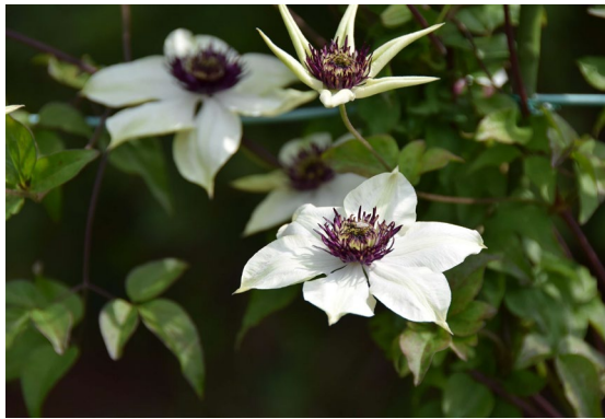
テッセン 日本でも古くから栽培されており、新しい品種の原種の一つにもなっている。5月中旬～下旬に開花する。