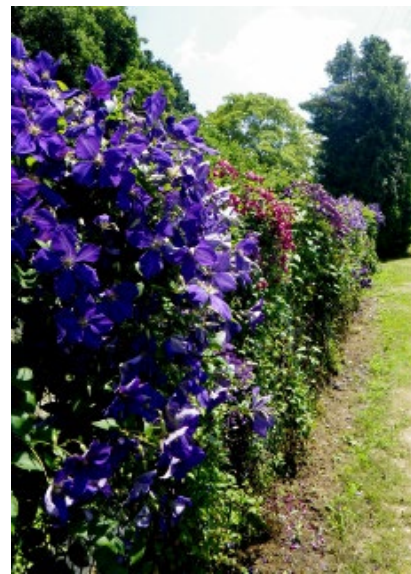
6月上旬 (ジャックマニー系など)