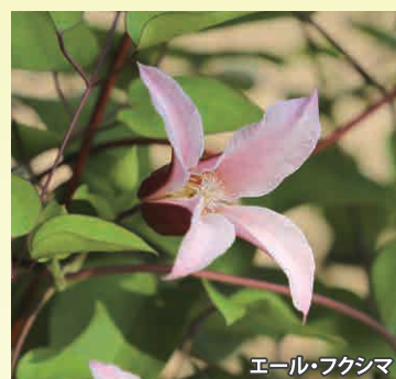
エール・フクシマ