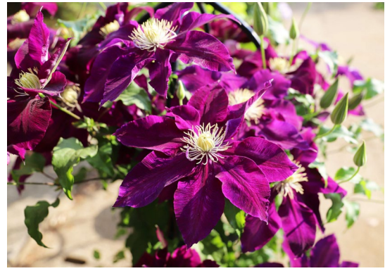
はやて フロリダ(テッセン)系の品種で21世紀になり日本で生まれた園芸品種。5月中旬頃に開花する。