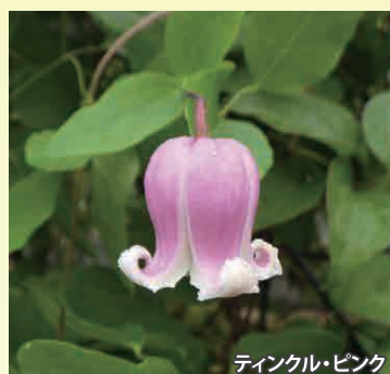
ティンクル・ピンク