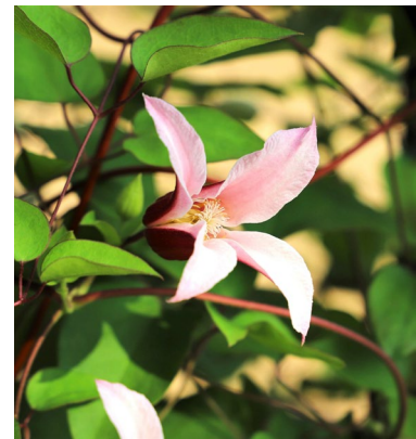
エール・フクシマ (福島発の新しい品種)

クレマチスとは、キンポウゲ科センニンソウ属( Clematis )に分類される植物の総称で、日本にはカザグルマ、ハンショウヅルなど30種以上(変種などを含む)が自生しています。また、日本のカザグルマや、中国原産とされるテッセンなどの世界各地の野生種をもとに、多彩な園芸品種が作出されてきました。