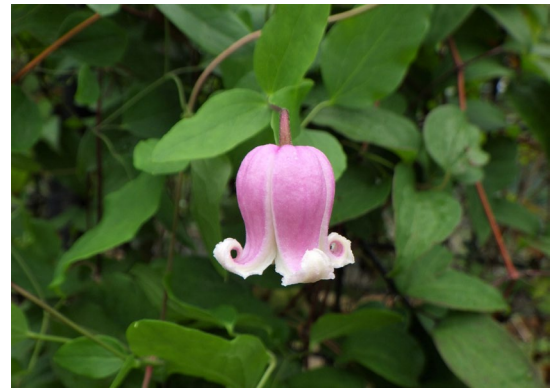
ティンクル・ピンク 原種はアメリカに分布するヴィオルナ系の品種で、可愛らしい花を咲かせる、最新品種の1つ。