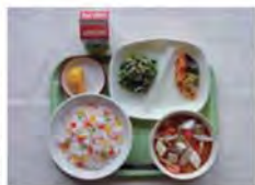
平成15年当時の学校給食