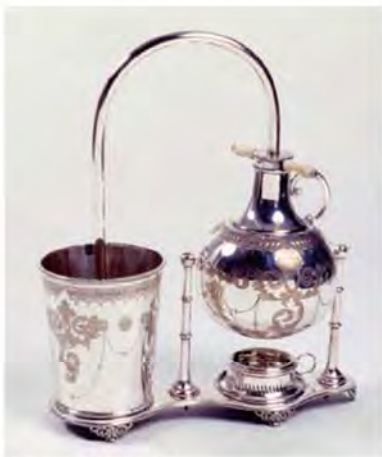
ナービア式サイフォン イギリス(19世紀後半頃) 銀細工師による装飾性の高い銀製のサイフォン。左のカップ型の器にコーヒーの粉と少量の湯を入れ、右のフラスコに水をセットする。