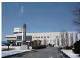
トモエ乳業 牛乳博物館