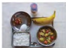
昭和52年当時の学校給食