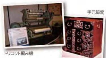
トリコット編み機