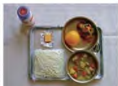
昭和40年当時の学校給食