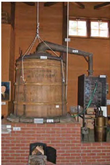
田中式ハッカ蒸溜装置 1933年(昭和8)に開発された田中式ハッカ蒸溜装置は、効率よくハッカ油を抽出でき、国内外で広く使われました。