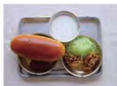
昭和27年当時の学校給食