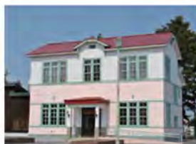
北見ハッカ記念館 薄荷蒸溜館