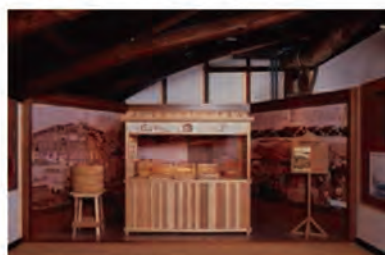
江戸前握り寿司の誕生