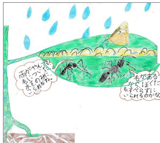
毛のやく目 毛は水をすってねにとどけるのかな