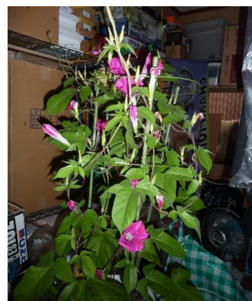
なん戸のあさがお開花の様子