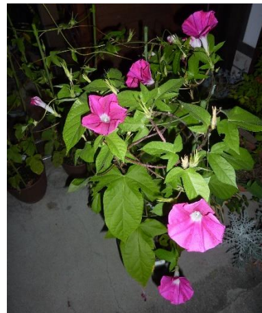
家の外のあさがお開花の様子