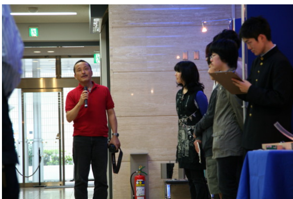
日本大学芸術学部の木村教授より講評のコメント