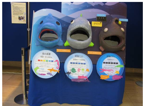
【2班】 「うみはふかいなおおきいな」 海の深さが変わると何が変わるのか