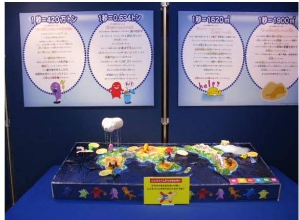
【1班】 「こじろう君が行く！～世界の水問題～」 1秒という短い時間の中でどれほど環境問題に動きがあるのか