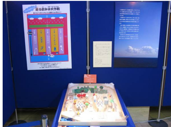
【3班】 「自然の中を乗りこえろ！ めぐる飲み水大作戦」 自然を海、雲、森とめぐる水の流るの様子をピンボールで知ってください！