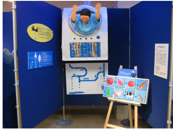
【4班】 「ただ今脱水中」 人間の水分は60%。生き物にとって水とは？