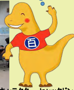
岐阜県博物館キャラクター:ヒャックドン

【主催】岐阜県博物館 【共催】国立科学博物館・公益財団法人日本博物館協会(予定) 【後援】文部科学省(予定)