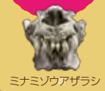
ミナミノウアザラン