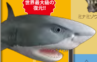
カルカロドン・メガロドン