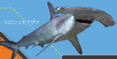
シロシュモクザメ