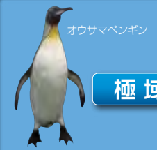
オウサマペンギン