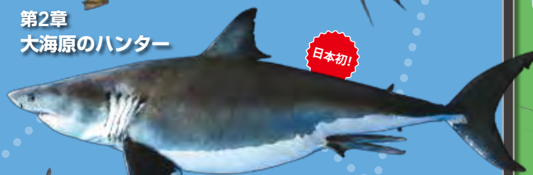
成魚の液浸標本 ホホジロザメ